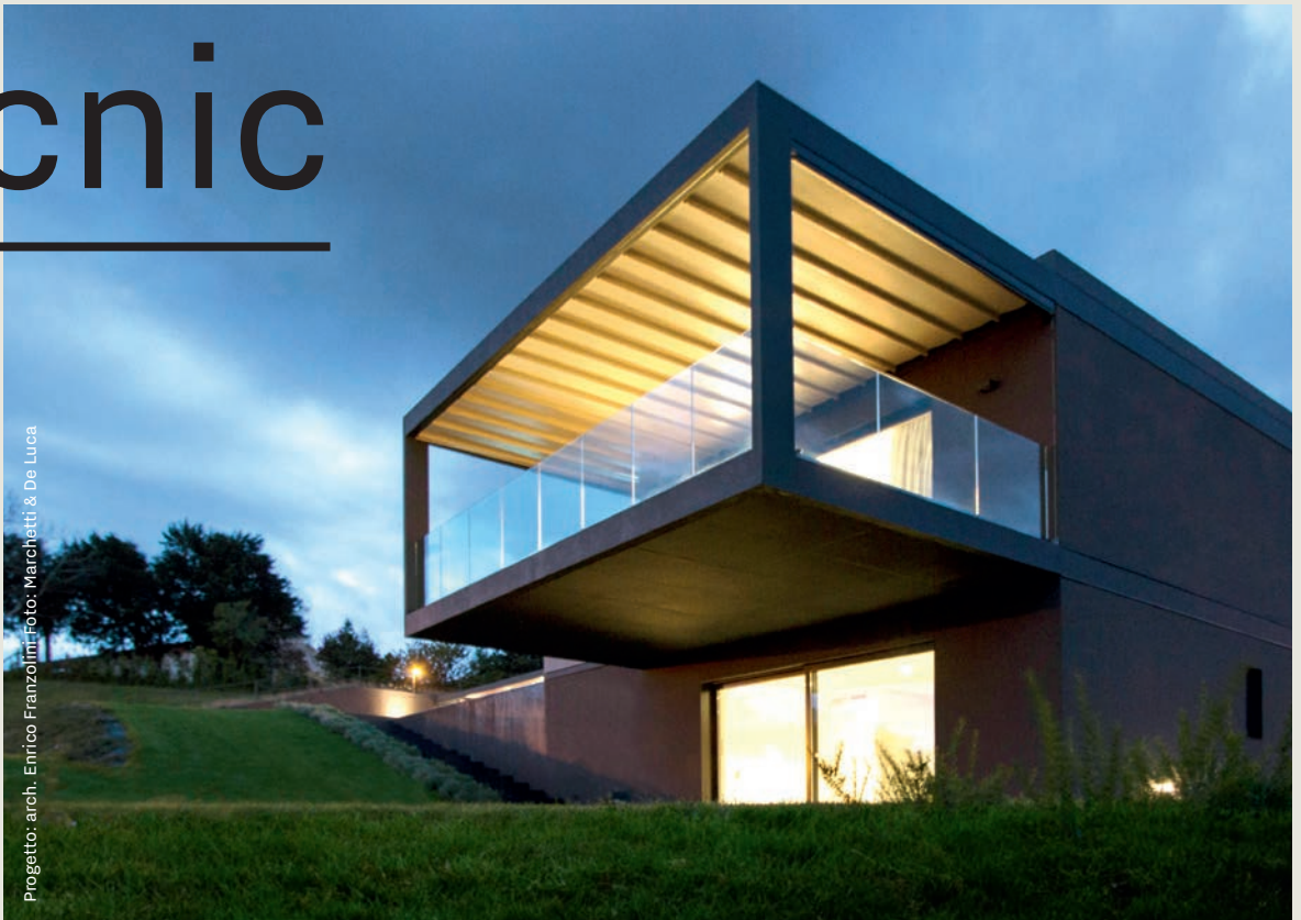
Progetto: arch. Enrico Franzoloni.

Tecnic è la copertura ideale per ogni spazio. Il meccanismo di scorrimento su guide in alluminio consente al telo, oscurante e impermeabile, di aprirsi e chiudersi ad impacchettamento proteggendo da sole, pioggia e vento.